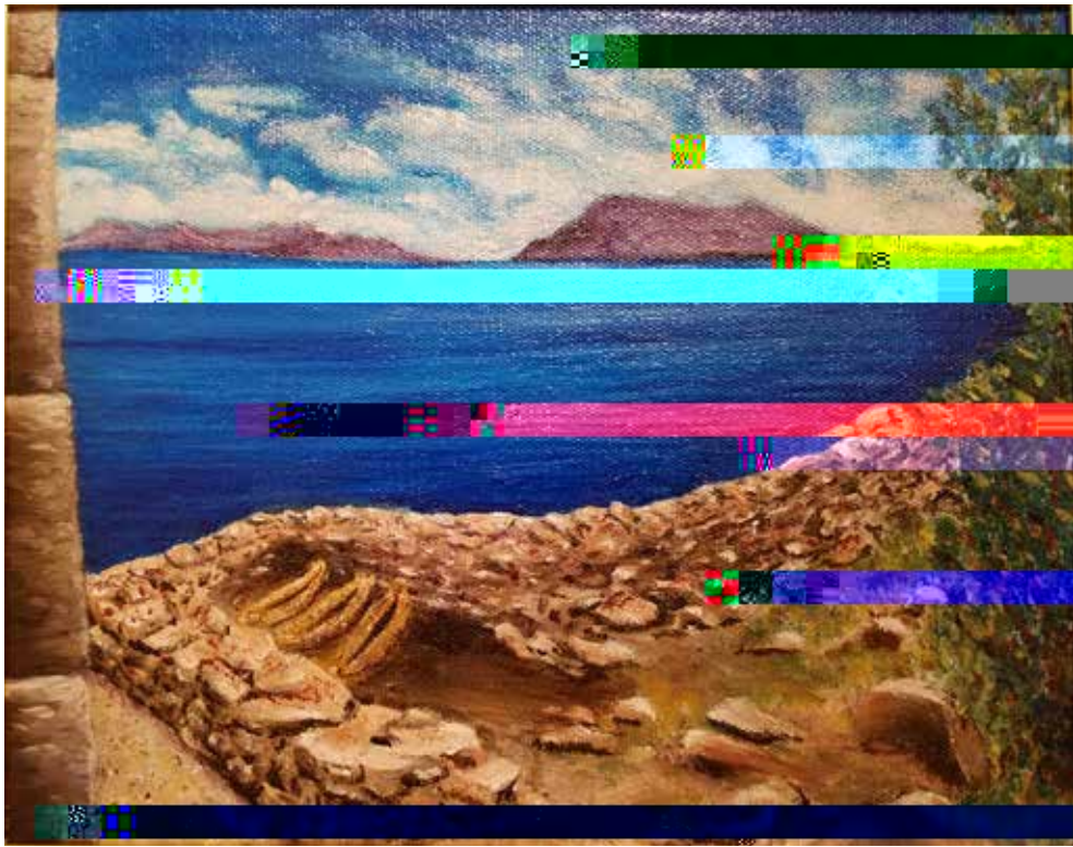
MEMORIAS DE TITICACA Elaine M. Bieber